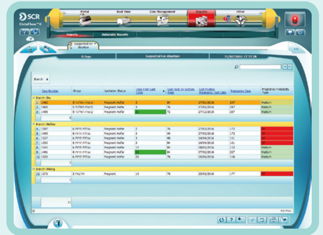
Podjęcie konieczności przeprowadzenia aborcji