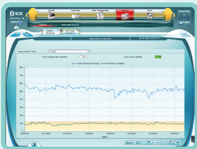
Wykres Spójności Grupy