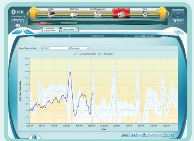
Zastosowanie Rutyny Grupowej - Wykres Przeżuwania