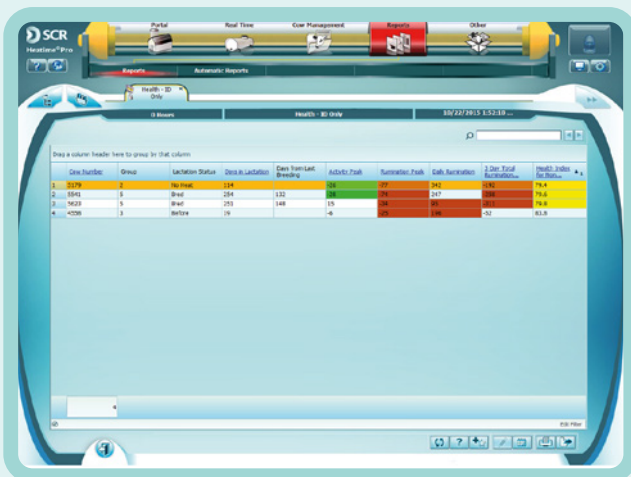
Raport o Stanie Zdrowia