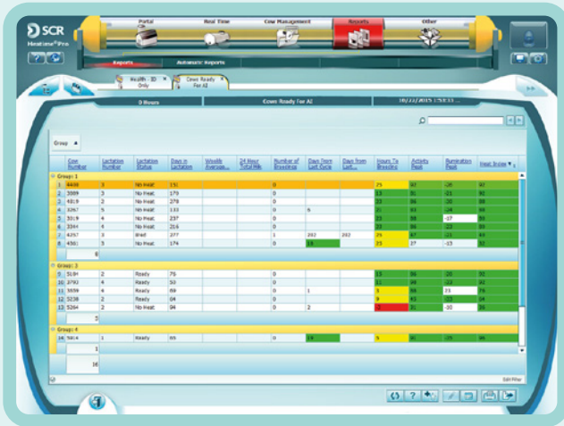
Raport na temat Rui